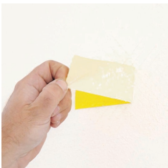
Obr.1 Příp. zkouška přidržitosti podkladních vrstev.