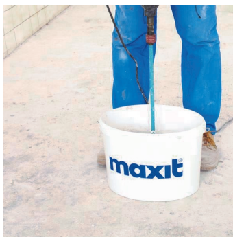
Obr.3 Promíchání penetračního nátěru.