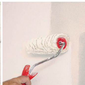
Obr.4 Provedení penetračního nátěru v 1 vrstvě.